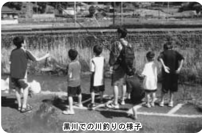
黒川での川釣りの様子

子どもたちが達成感と自信を得られるような環境を提供し、成長を見守りたいと思います。