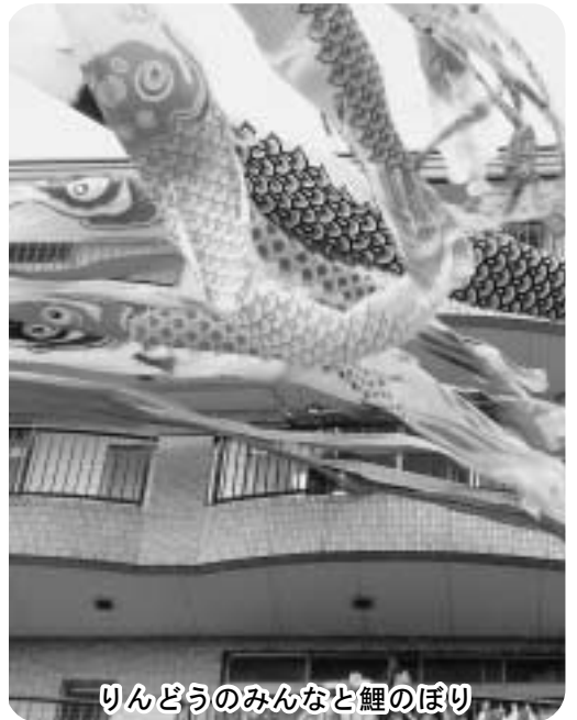
りんどうのみんなと鯉のぼり