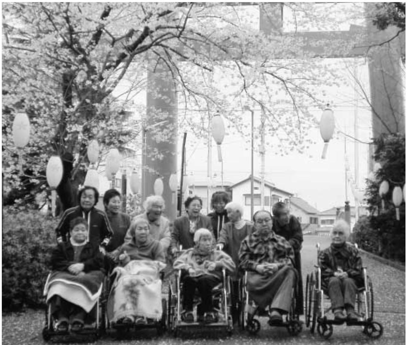
春の陽差しを浴びて