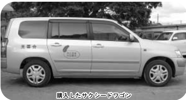
購入したサクシードワゴン

この度、赤い羽根共同募金からの援助を受け、ひまわり園の公用車を購入させていただきました。購入させていただいた車はトヨタのサクシードワゴンです。大きな荷室スペースがあり、たくさんの荷物ができる行事や、子どもたちの部活の送迎などで大活躍してくれそうです。共同募金会ならびに、募金をしてくださった方々一人ひとりに厚く御礼申し上げます。